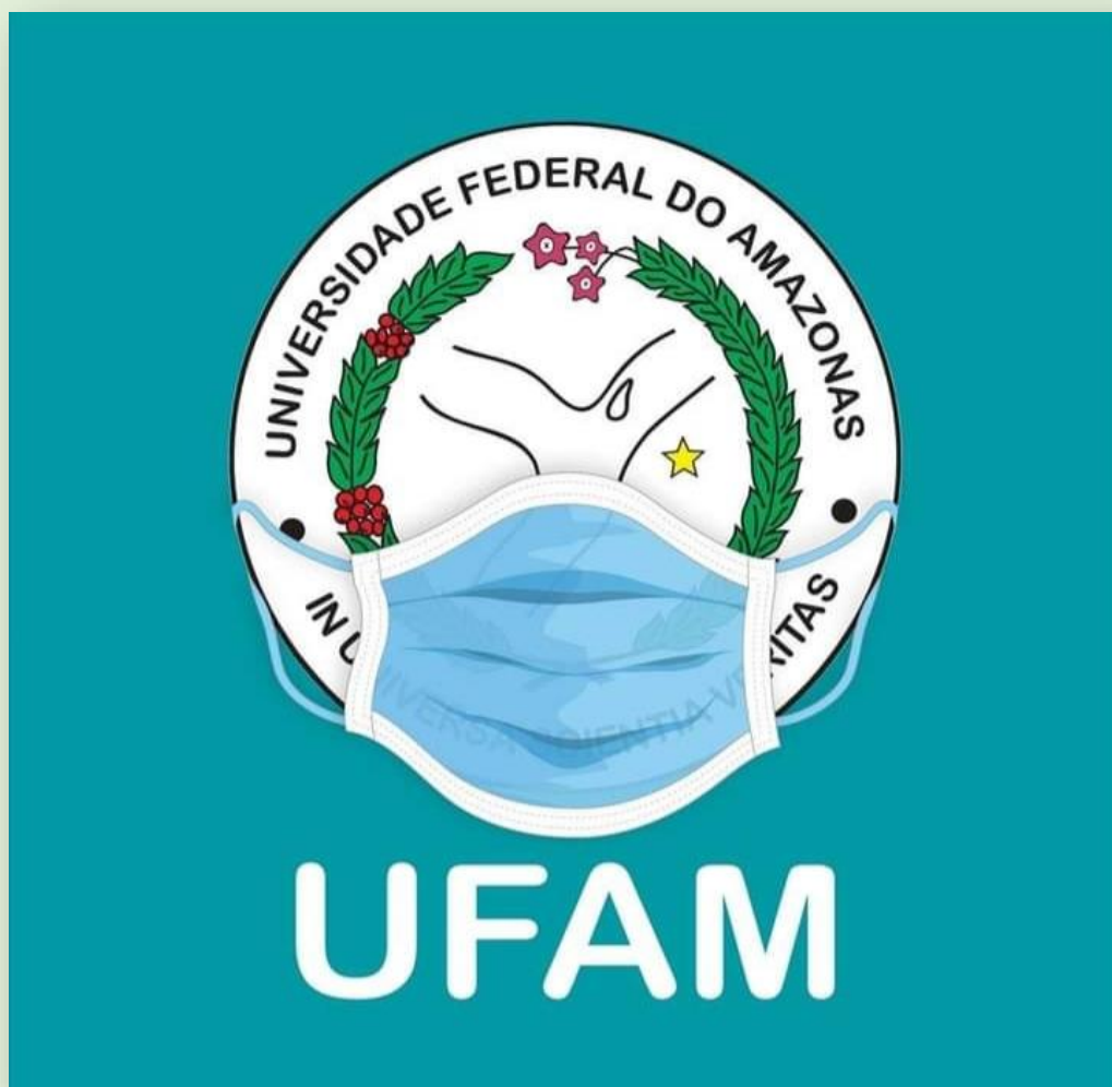
Figura 2 - Assessoria de Comunicação da UFAM (ASCOM), 2021.

Os artigos escolhidos para o mês de abril de 2022 são: