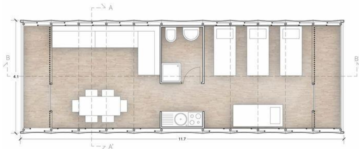
Figura 3 - Planta baixa do abrigo.