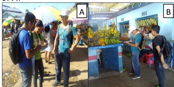
Figura 3 - Coleta de dados (A) Feira Livre e (B) Feira Coberta do município de Benjamin Constant - AM, 2014.

O Instrumento de coleta de dados é o meio pelo qual a informação sobre as variáveis é coletada (BARBOSA, 2008). Foi elaborado um instrumento de dados e sua aplicação (Figura 3) ocorreu nos sábados, totalizando 8 (oito) amostragens. Objetivou-se levantar dados sobre produção agrícola da região, suas variações no preço de compra e venda, a diversidade de espécies, época e origem, para alimentar um banco de dados sobre produtos agrícolas desta região.