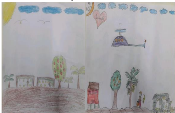
Figura 2: Desenhos produzidos pelos alunos da comunidade representando as etapas de cultivo do maracujá.

De acordo com as ilustrações feitas pelos alunos, averigou-se a importância de vincular os saberes empíricos e científicos, com isso pode-se notar a compreensão dos alunos em relação ao tema. Os desenhos são uma forma avaliativa capaz de nos mostrar o nível de assimilação dos alunos, analisando os desenhos podemos perceber que os alunos conseguiram nivelar os conhecimentos obtidos através de seus familiares com os repassados em sala de aula. Figura 2