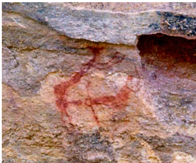
Toca do Baixão da Vaca, Serra da Capivara, Parque Nacional Serra da Capivara – PI. Cena de sexo com mulher grávida.

Parece-nos que as mulheres tinham papéis sociais na religiosidade e na vida cotidiana. Segundo Simone de Beauvoir, causavam nos homens primitivos uma veneração que se misturava ao receio que se refletia nos seus cultos. A mulher encarnava, para o homem, o aspecto desigual da natureza. Os filhos vinham-lhe como presentes sobrenaturais. Os enigmáticos fluxos do corpo da mulher consentiam trazer a este mundo os tesouros que jaziam no fundo das nascentes da vida. Por isso as figuras de “mulher” da época das cavernas eram usadas como objetos de culto e magia. Elas não representavam pessoas, personificavam mistérios (BEAUVOIR, s/data).