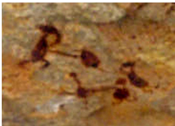
Toca do Baixão da Vaca, Serra da Capivara, Parque Nacional da Serra da Capivara – PI. Cena da coleta do mel. Coletar é um trabalho essencialmente feminino.