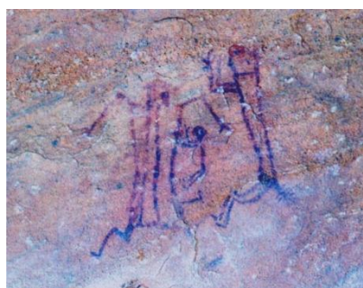
Toca do Baixão do Perna V. Cena de amamentação. (Serra Talhada)

Sabe-se que todos esses afazeres poderiam ter sido divididos, e/ou feitos em conjunto (menos, é claro, a amamentação natural e a gravidez), conforme atestam as pesquisas etnográficas com tribos dos EUA, por exemplo, onde existe uma flexibilidade em definir os papéis de gênero. Assim, os paleoíndios, de forma geral, em todo o continente americano, podem ter organizado seu cotidiano de modo indefinido a priori (ADOVASIO et al , 2009, p. 237).