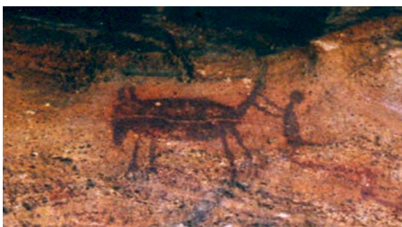
Toca da Fumaça, Serra da Capivara, Parque Nacional da Serra da Capivara – PI. Humano caçando.

Em São Raimundo, é comum ver cenas de antropomorfos caçando e de animais sendo atingidos por lanças ou mesmo correndo em bandos. Não temos certeza de que todas as cenas retratam apenas homens caçando. Parece-nos que as mulheres participavam ativamente das ações sociais em iguais condições que os homens. Além de desenvolverem e realizarem seus afazeres elas ajudavam os homens em seus próprios afazeres. Eram participes interagindo nos eventos cerimoniais exercendo, talvez, funções dentro dos rituais religiosos (AUDEL, 2000).