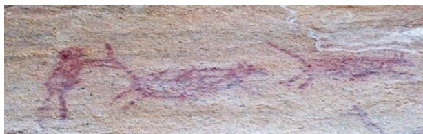
Toca do Alto do Fundo da Pedra Furada, Serra da Capivara, Parque Nacional da Serra da Capivara – PI. Cena de caça.

Embora a educação, no geral, ficasse a cargo das mulheres, o ensino da caça cabia aos homens. Para Reed, o ato de caçar era educativo, pois propiciava um ótimo exercício para o corpo e a mente. Caçar estimulava a cooperação, o autocontrole, a agressividade, a engenhosidade e as invenções. Ou seja: caçar foi uma grande escola para a formação dos grupos humanos (IDEM, p. 43). Existe a possibilidade de as mulheres terem sido caçadoras e ou participado das investidas em busca da carne (AUDEL, 1982), como nos mostram algumas pesquisas etnográficas (SILVERWOOD-COPE, 1990) e, ainda, as caçadas poderiam ter sido, exclusivamente, também de papel feminino em muitos grupos (ADOVASIO et al , 2009, p. 240).