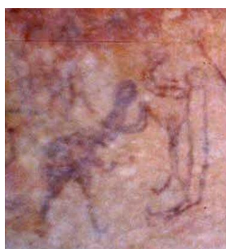
Toca da Pedra Preta I, Serra Branca, Parque Nacional da Serra da Capivara – PI. Cena de cuidados familiares.

Pelo fato de terem a responsabilidade materna, as mulheres, ao contrário do que muito se escreve, eram investidas de poder e prestígio nas comunidades primitivas. A maternidade não era vista como um momento de sofrimento ou que simbolizava a inferioridade do gênero (REED, 1980, p. 34). Tinham papel importante no seio das sociedades primitivas, impedindo a tirania sociocultural ou econômica dentro dos grupos (JUSTAMAND, 2010, p. 94).