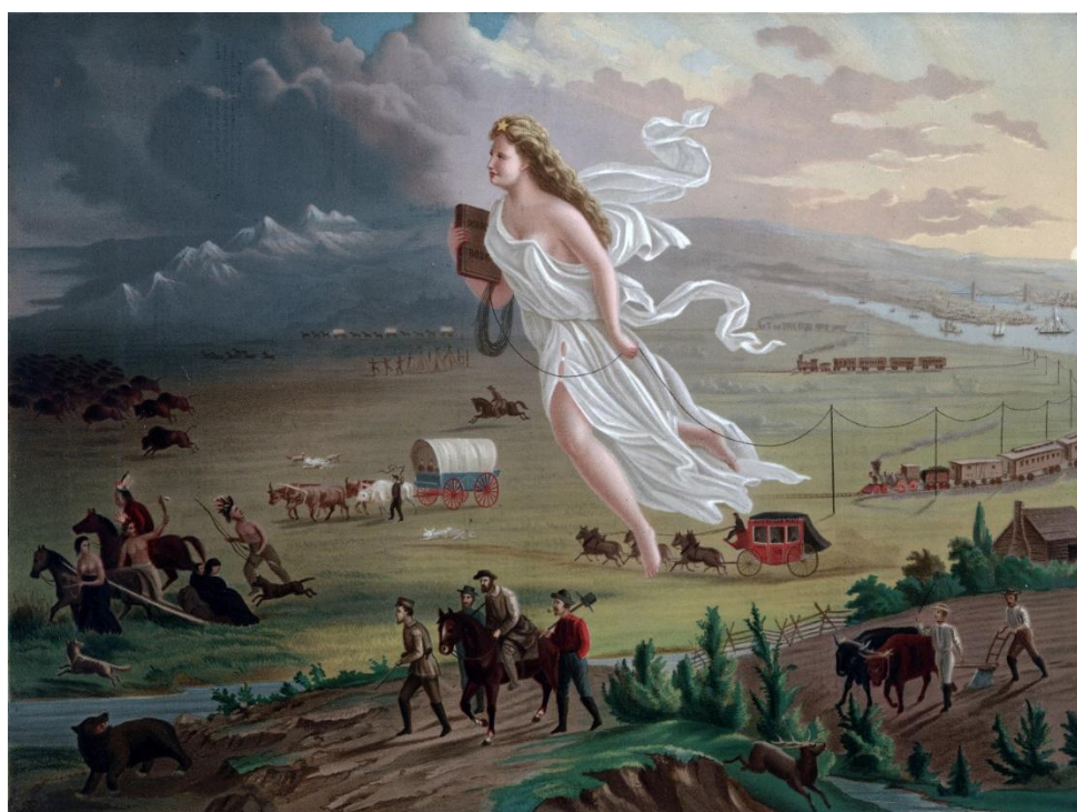
Figura 2. American Progress , de John Gast.